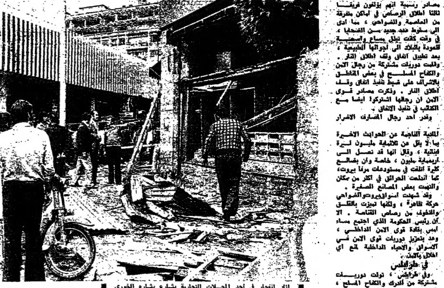
اتار التجار في أحد المصالح التجارية بشرح بشارة الخوري

الصحافة تقرر الامتناع عن نشر انباء الاشارة والتحريض وقد اتى التقيب طه كرامة في الاجتماع، وتكلم عدد من الزملاء حول نقضه الوطنية وضرورة تطبيق الرقابة الذاتية بدقة مع احتفاظ الصحفها في نشر الانباء والتعليقات من دون إثارة وتحريض، اجمع الحضور، وفي ختام الاجتماع، اجمع الحضور